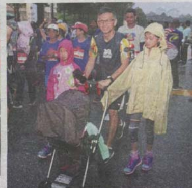
Families with babies in strollers and children kitted out in colourful raincoats also took part in the event.