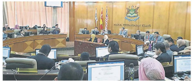
巴生市议会提呈 2020 年财政预算案后，再进行常月会议。

他说，市民只要扫描有关二维码便可完成有关评估，包括评级、给予回馈意见、提出建议等，以让市议会收集民意，借此作为改善巴生环境卫生问题的方案。