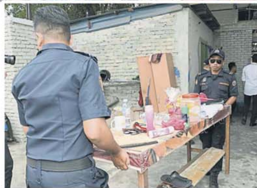
建房间的物件先移出来。执法人员在拆除工作开展前，将违