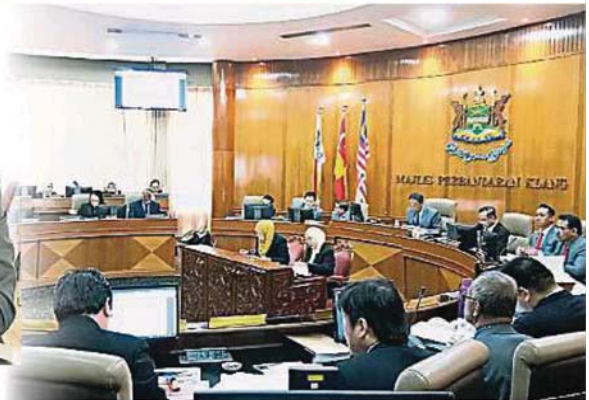
巴生市議會召開8月份常月會議,商討各個大小事務。