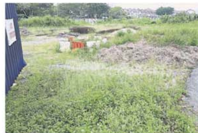
班丹福全山庄中华华小校地目前杂草丛生。

梁国伟提及，当年时任教育部副部长张盛闻曾答应，该部每年拨款 100 万令吉给福全山