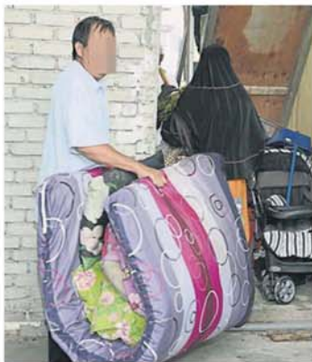
来自印尼的外劳眼见房间即将被拆，忙将细软搬出屋外。

“为了避免被市议会采取行动，我奉劝大家在开始任何建筑工作之前，请通知市议会，得到批准才来动工。”