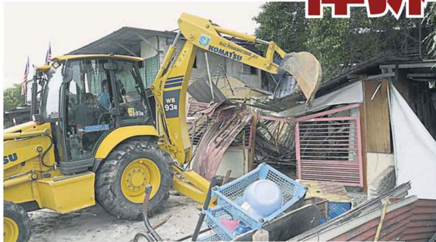
市议会展开联合行动，到 5 个违建的单位展开拆除行动。

1974 年道路、沟渠及建筑物法令（133 法令）第 72 条文前来拆除违建的建筑。”