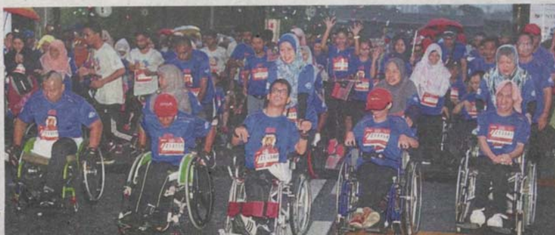
The fun run category included disabled participants in wheelchairs.