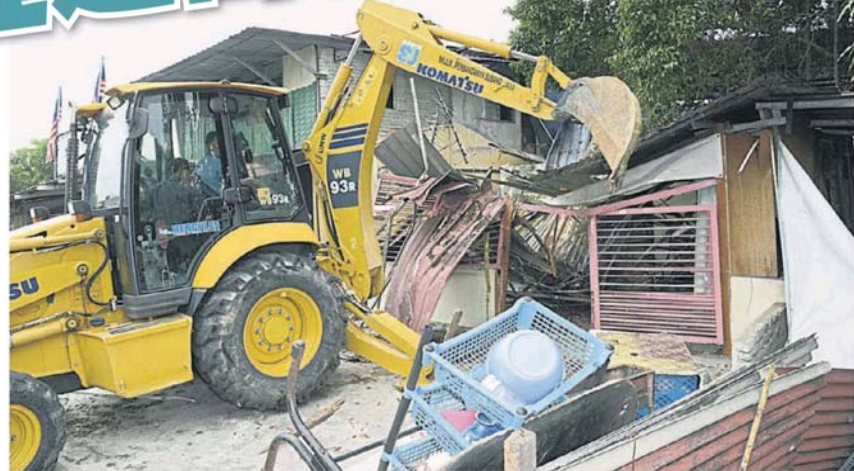
市议会展开联合行动，到5个违建单位进行拆除行动。

单位后，也将当中的物件全数搬出来，随后才断电和出动铲手，将违建部分拆除。 市议会建筑物组高级助理主任沙菲宜在沙登再也5/2路拆除违建餐馆现场，召开记者会时指出，当局此次的拆除行动是因为接获建建的商店是由外劳做生意。 限30天清空土地 他说，当局早在7月2日发出通知信，指示限定涉及的人士在30天内清空土地。 “通知信的期限是8月1日，故市议会今日援引1974年道路、沟渠及建筑物法令（133法令）第72条前来拆除违建建筑。 他说，遭拆除建建的业主是本地人，而做生意的却是外劳，业主曾向市议会作出求情，但是不被市议会接受。 “市议会已经依据程序发出清空土地通知，也给予30天期限。”