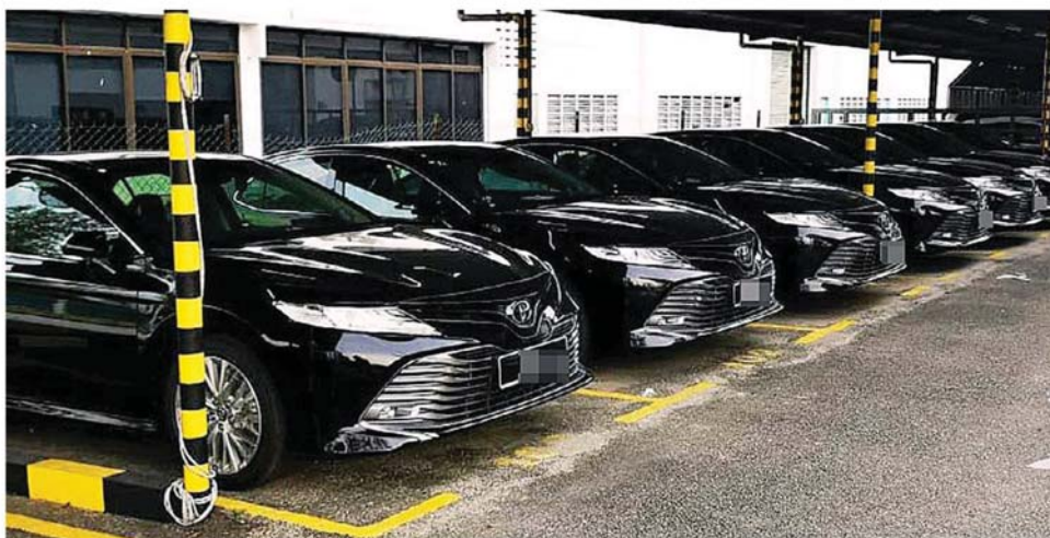
财政部宣布，檳城州政府今年所购入的新一批官车，无法获得享有免税的优惠。