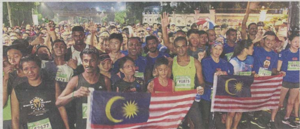
The PJ Half Marathon, touted as Malaysia's oldest half marathon, recorded a total of 10,000 participants this year.

"The PJ Half Marathon is a highly anticipated annual event. We even had to close registration early as the organisers had